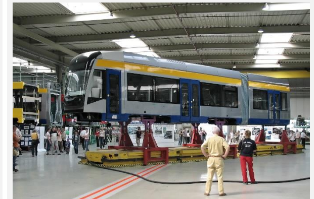
Blick in die Endmontagehalle

Der Bau von Schienenfahrzeugen hat in Bautzen eine lange Tradition. Die nach 1990 entstandene Waggonbau Bautzen GmbH gehört mittlerweile zu Bombardier Transportation (Teil des ALSTOM-Konzerns). Innerhalb des Konzerns ist das Werk in Bautzen das Kompetenzzentrum für die Herstellung von Stadt- und Straßenbahnen. Die HTW Dresden, Fakultät Geoinformation erprobt hier die Automatisierung von Messprozessen durch die Kombination von Lasertracking und autonomem Laserscanning. Die Führung gibt einen Einblick in die Produktionsprozesse im Waggonbau.